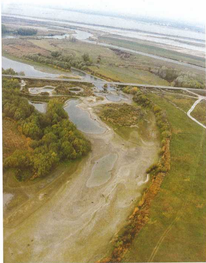
Dunakiliti, 1992. október

1992. október 27. A felek az EK Bizottsága képviselőjének bevonásával folytatott tárgyaláson aláírták az ún. londoni jegyzőkönyvet, ez háromlépcsős rendezési eljárást rögzít. A felek vállalták, hogy az országok közti jogvitát közösen a hágai Nemzetközi Bíróság elé tárják, a Bíróság ítéletéig tartó időszakra átmeneti vízmegosztást alkalmaznak. A csehszlovák fél ígéretet tett, hogy a mederelzárástól függetlenül, még a határszelvény előtt a Duna vizének legalább 95 százalékát az eredeti mederbe engedik. Ezen utóbbi vállalását a csehszlovák fél nem teljesítette.