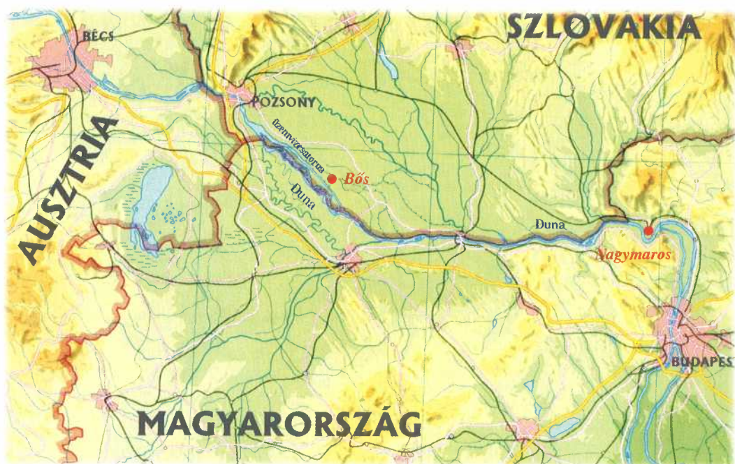
A Duna Bécs és Budapest között

„S ha a Bíró leül ottan ami csak lappang, kipattan, mísem marad megtorlatlan.”