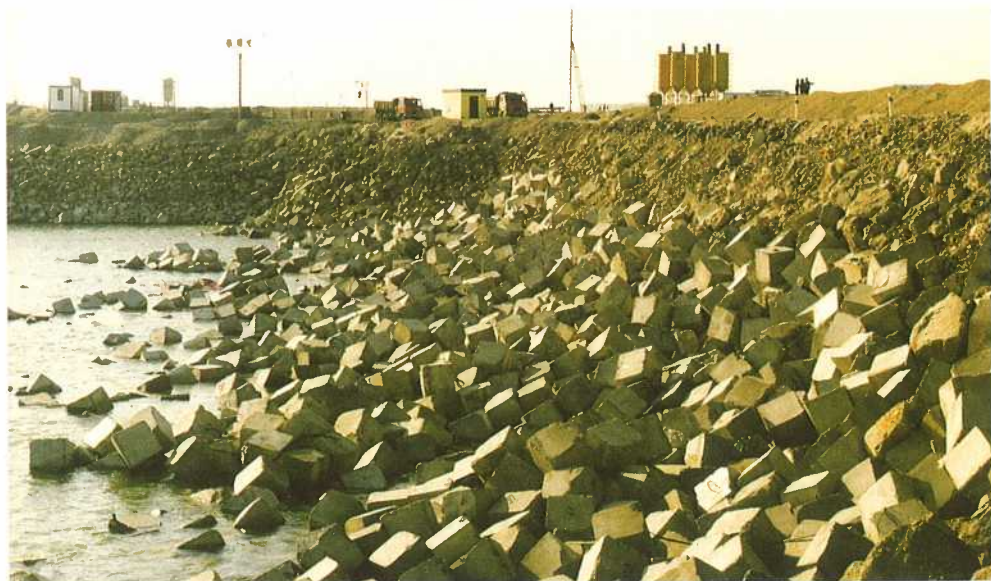
A dunacsúnyi mederelzárás, 1992