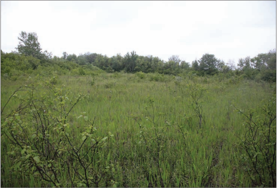
4. ábra: Gyórladamér, Patkányosi – rét (XVI.), kiszáradó, cserjésedő mocsárrét Fig. 4: Gyórladamér, Patkányosi – meadow (XVI.), aridified, shrubby meadow