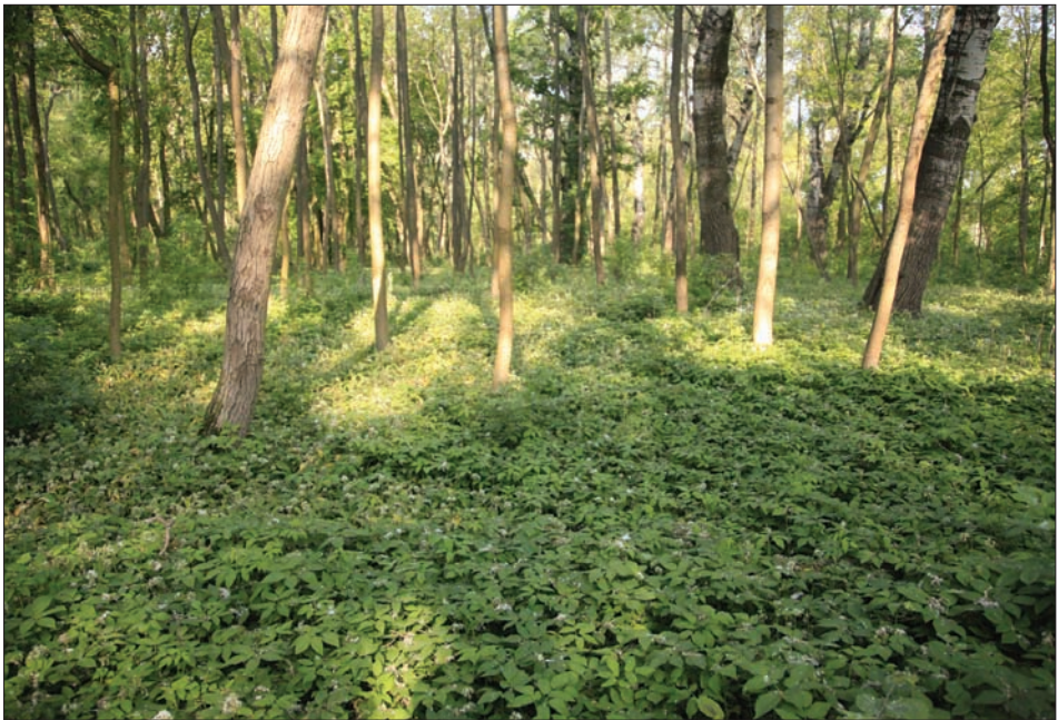
3. ábra: Rajka, Alsó-erdő (V.), medvehagymás keményfás ártéri erdő Fig. 3: Rajka, Alsó-forest (V.), hardwood forest with ramsons