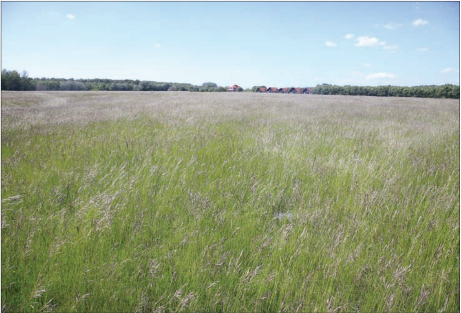
5. ábra: Halászi, Ugoi-legelő (XII.), Szigetköz egyetlen löszgyepe Fig. 5: Halászi, Ugoi-pasture (XII.), Szigetköz's only loess grassland