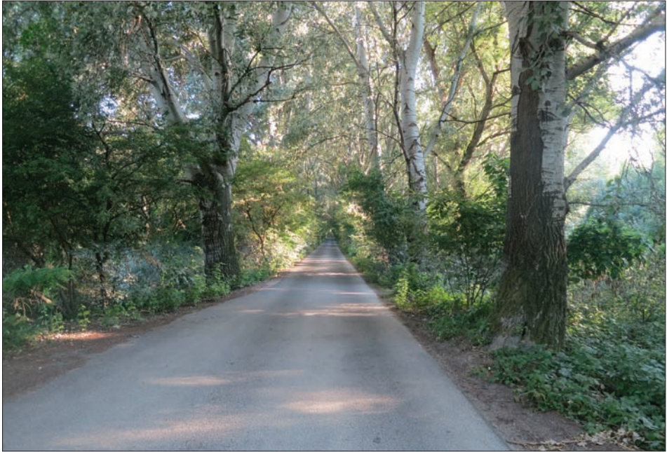
2. ábra: Dunaszentpál, Bolgányi-híd (XVII.), vizsgált fűz-nyár ártéri erdő Fig. 2: Dunaszentpál, Bolgányi-bridge (XVII.), softwood forest