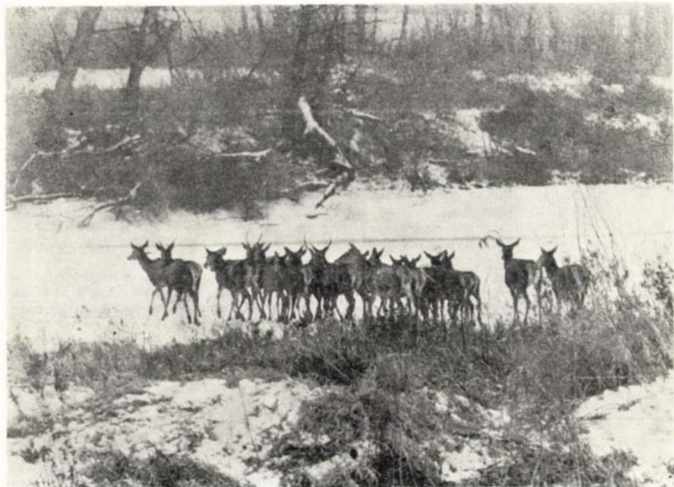
Szarvasok a Duna jegén.

A magasabban fekvő Felső-Szigetközben uralkodó erdőtípus a tölgy-köris-szil ligeterdő. Ennek szép maradványai élnek a Feketeerdő mellett, de másutt is megta-